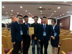
连锁经营管理专业学生参加全国高校商业精英挑战赛流通业经营模拟竞赛获全国二等奖