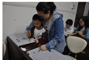
“希望助教班”志愿服务活动