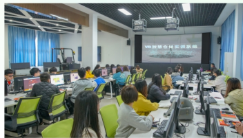
物流管理专业VR虚拟仿真实训室