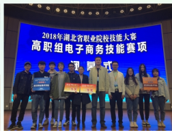
电子商务专业学生在2018年湖北省职业院校技能大赛高职组“电子商务技能”竞赛中荣获推荐组一等奖、抽测组二等奖