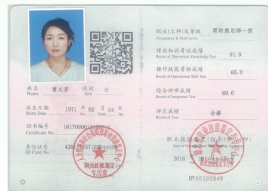
投资与理财专业教师获人力资源和 社会保障部颁发的一级理财规划师证书