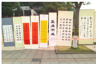
书法协会部分书法作品展示