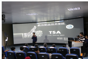
学生参加梦想卓创咨询有限公司 创新创业项目路演