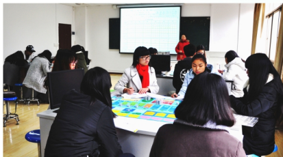
企业资源规划（ERP）沙盘模拟实训

学生实训实习平台多样，校外有多家紧密合作企业，包括百胜中国、盒马鲜生、名创优品等，校内建有企业经营管理实训室、企业资源规划（ERP）沙盘实训室等实训基地。在保证学生学、练结合的同时，多渠道解决学生就业、推动学生创业。