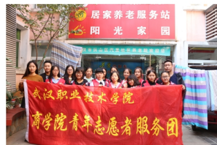
学生赴阳光家园敬老院 开展志愿服务活动