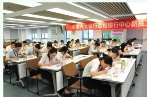
理财专业学生到光大银行 武汉远程中心银行实习

投资与理财专业建有金融综合实训室，配备有投资理财规划仿真实训软件、保险综合业务仿真实训软件、商业银行柜台业务仿真实训软件、银行业务综合技能仿真实训软件等。本专业还建有武汉农村商业银行、光大银行、招商银行、招商证券、长江证券、中国人保财险公司等校外实习基地。