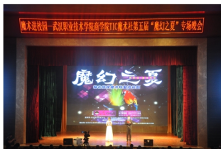
魔术协会举办“魔幻之夏”活动