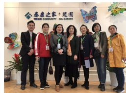
专业教师赴校企合作企业 泰康人寿调研