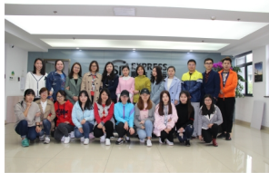
顺丰速运部分就业学生

物流管理专业拥有湖北省物流实训基地、物流VR虚拟仿真实训室、智慧教室等。物流实训基地开展仓储配送的模拟操作实训、国际货运代理实训、物流企业模拟经营实训，物流虚拟仿真实训室依托虚拟仿真软件、VR设施设备开展VR智慧仓储实训、3D叉车操作实训、仓配运输管理实训。本专业与顺丰速运、苏宁云商等行业知名企业建立了校外实训基地，学生在校外实训基地开展多种形式的实习活动。