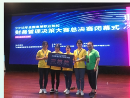
会计专业学生获2018年全国高职院校财务管理决策大赛总决赛三等奖