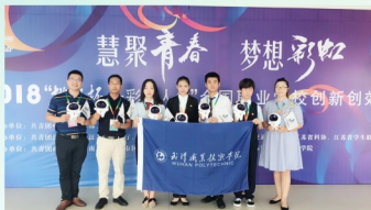
电子商务专业“2fans二次元综合服务平台”项目在2018年“挑战杯—彩虹人生”全国职业学校创新创业大赛上荣获生产工艺革新类二等奖