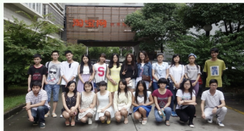
电子商务学生杭州淘宝基地实习