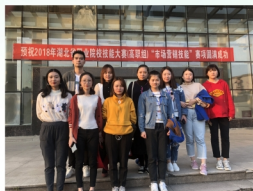
市场营销专业学生在2018年全国职业院校技能大赛高职组“市场营销技能”竞赛中荣获湖北省推荐组一等奖、抽测组二等奖