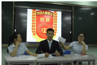
劳动关系管理课程—劳动争议仲裁实训