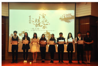
“书香校园-超级演说家”演讲比赛