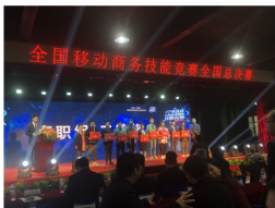
移动商务学生获得2018年全国移动商务技能大赛二等奖