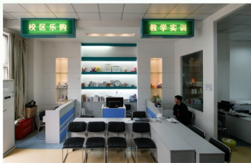
移动商务专业校内实习场景