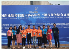
投资与理财专业学生在“2018年全国职业院校技能大赛（高职组）银行业务综合技能竞赛”中荣获全国二等奖

学院师生在各项比赛中屡获佳绩，近五年来，200余人次分别荣获国家级、省级教师教学比赛、学生技能大赛一、二、三等奖。