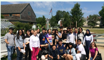
部分本专业学生赴美国南新罕布什尔大学交流学习

参加湖北省2019年普通高考, 达到高职高专批次录取分数线。我校对填报了该专业志愿的考生, 按照省招办的录取规则, 从高分至低分择优录取。