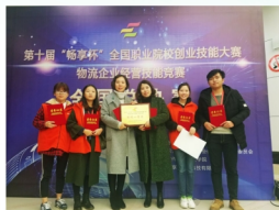
物流管理专业学生参加物流企业模拟经营比赛获全国一等奖