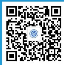
武职商学院二维码