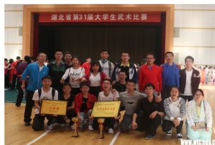
武术协会学生参加湖北省 第31届大学生武术比赛