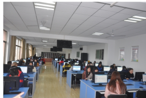
会计信息化实训室