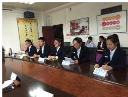
连锁经营管理专业学生在上商务谈判课

连锁经营管理专业建有ERP沙盘模拟实训室、商品陈列实训室、物流岗位实训室、连锁企业认知实训室、连锁企业实训室、店面进销存管理实训室。同时还建有百胜餐饮（武汉）有限公司、武汉中商集团股份有限公司实训基地、食全食美美食广场实训基地、名创优品实训基地等校外实训基地。