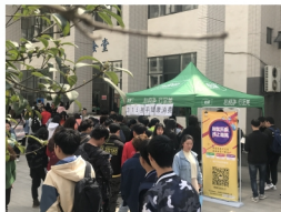
校园电商推广实践