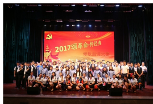
“颂革命·传经典”诗歌朗诵大赛