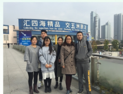
师生到义乌考察小商品市场