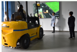
3D叉车驾驶实践教学