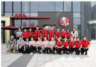
现代学徒制百胜订单班学生校外实训