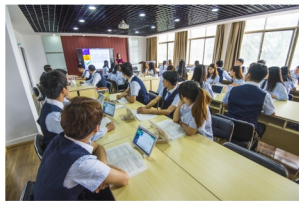
物流管理专业信息化教学场景