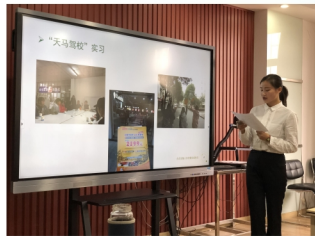
校内实训：学生团队为企业量身定制营销策划

市场营销专业现有商务综合、情景模拟、案例分析等多个校内实训室；与沃尔玛（省级校外实训基地）、百胜、名创优品、美联地产、南方航空、农业银行等知名企业共建了一批校外实训基地，可以充分满足学生培养需要。