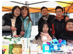
学生参加双12校园电商推广实践活动