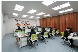
学生参加会计综合仿真实训