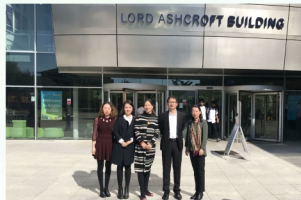
会计专业教师到英国 安格利亚鲁斯金大学交流