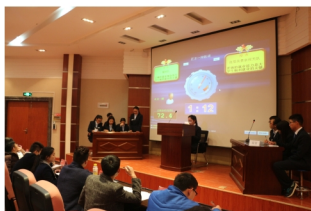
“金种子辩论赛”活动

学院开展各种活动丰富学生的课余生活，充分发挥学生自主性、能动性，培养其兴趣爱好。营造健康向上、积极活泼的校园文化环境，提升学生的综合素质，推动学院文化建设的发展。